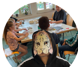
Falken Gelsenkirchen Rotthausen WhatsApp-Kanal

Wir feiern Karneval. Auf euch warten wieder viele Angebote wie Basteln, Spiele, Musik, Essen und Trinken, sowie natürlich einige Kamelle. Also Kostüm an und nichts wie loszum La Palma!