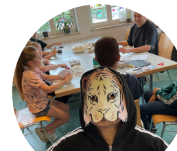
Falken Gelsenkirchen Rotthausen WhatsApp-Kanal

Wir feiern Karneval. Auf euch warten wieder viele Angebote wie Basteln, Spiele, Musik, Essen und Trinken, sowie natürlich einige Kamelle. Also Kostüm an und nichts wie loszum La Palma!